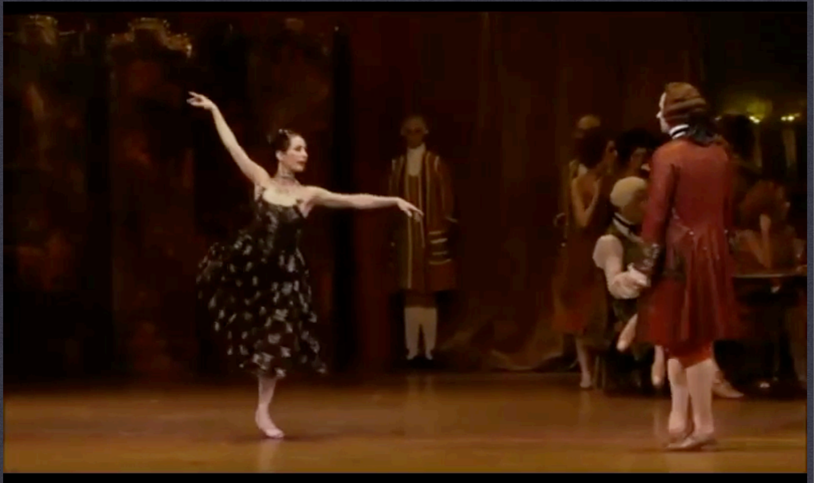
L'Histoire de Manon sobre música de Jules Massenet / Air de ballet TAMARA ROJO (PRIMA BALLERINA) / COREOGRAFÍA: KENNETH MACMILLAN / THE ROYAL BALLET / LONDON. 2008