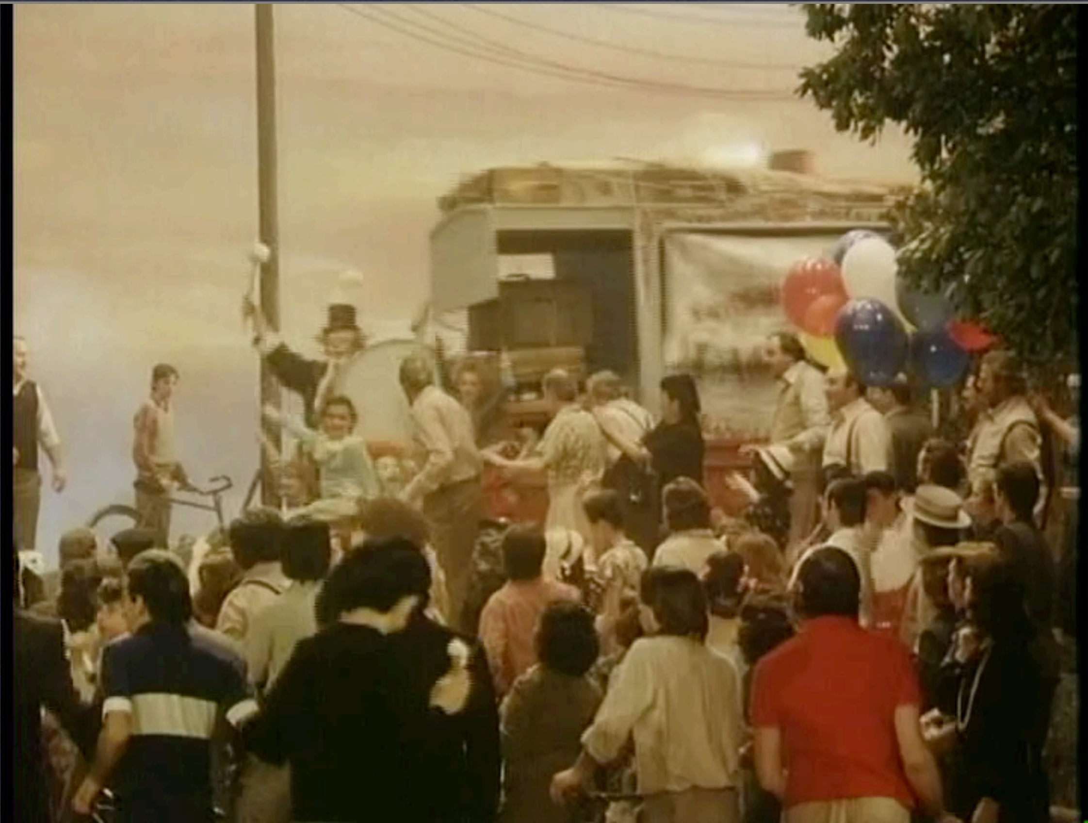
Un grande spettacolo a veintitrè ore / Acto 1º / Pagliacci de PLÁCIDO DOMINGO / ORCHESTRA DEL TEATRO ALLA SCALA / DIRIGEN GEORGES PÈTRE Y FRANCO ZEFIRELLI. 1982