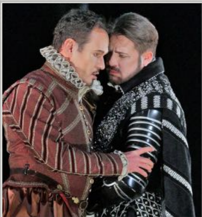
Roberto Devereux de Donizetti