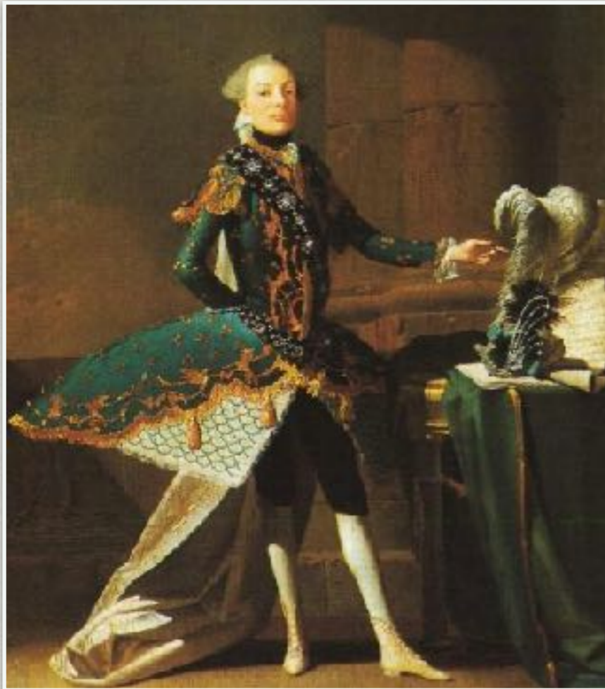
El castrato Carlo Scalzi