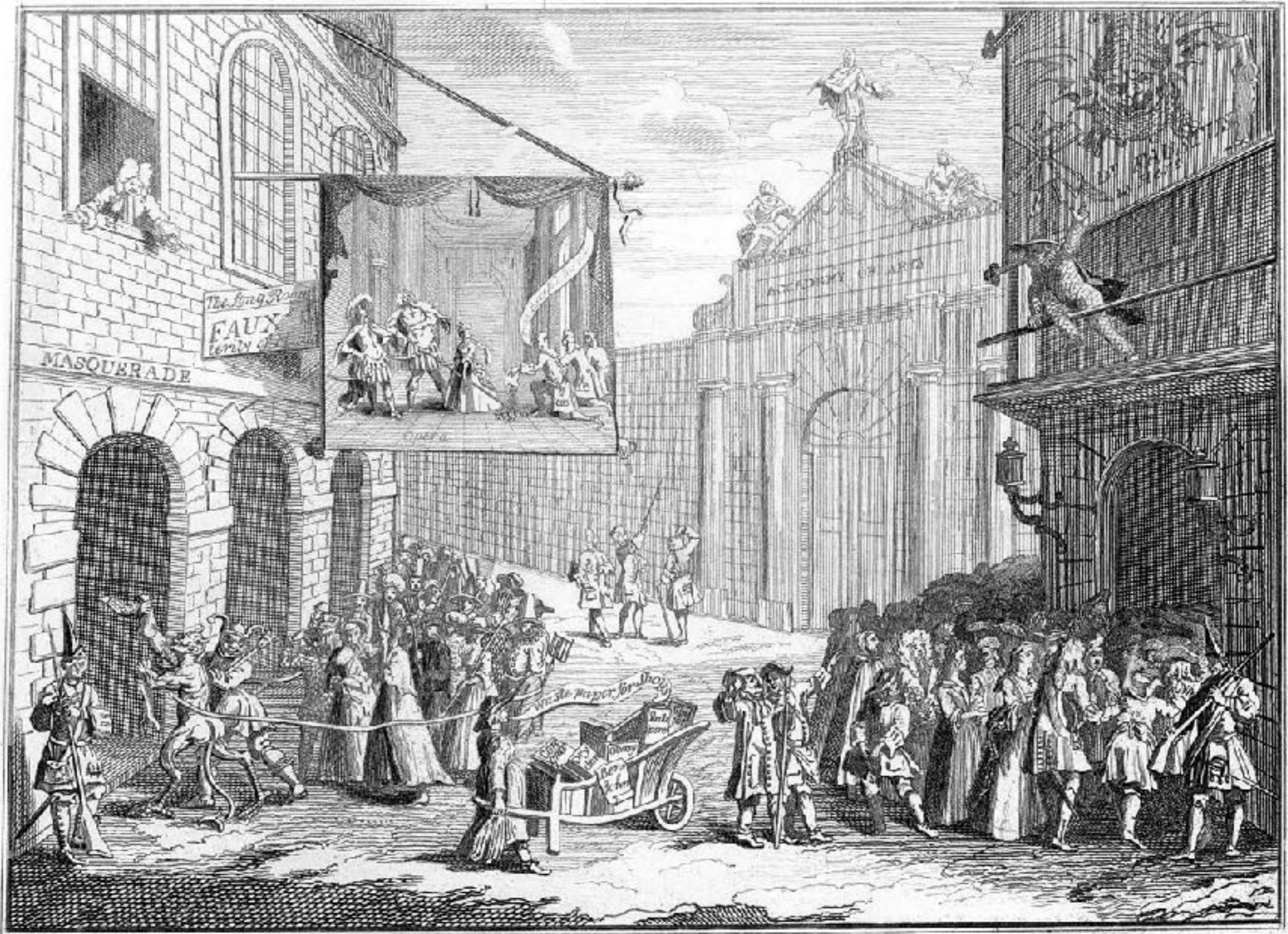
Masquerades and Operas / Grabado de William Hogarth (1724) El público acude a los espectáculos de Heidegger, Rich y Fawkes mientras desprecia la gran literatura