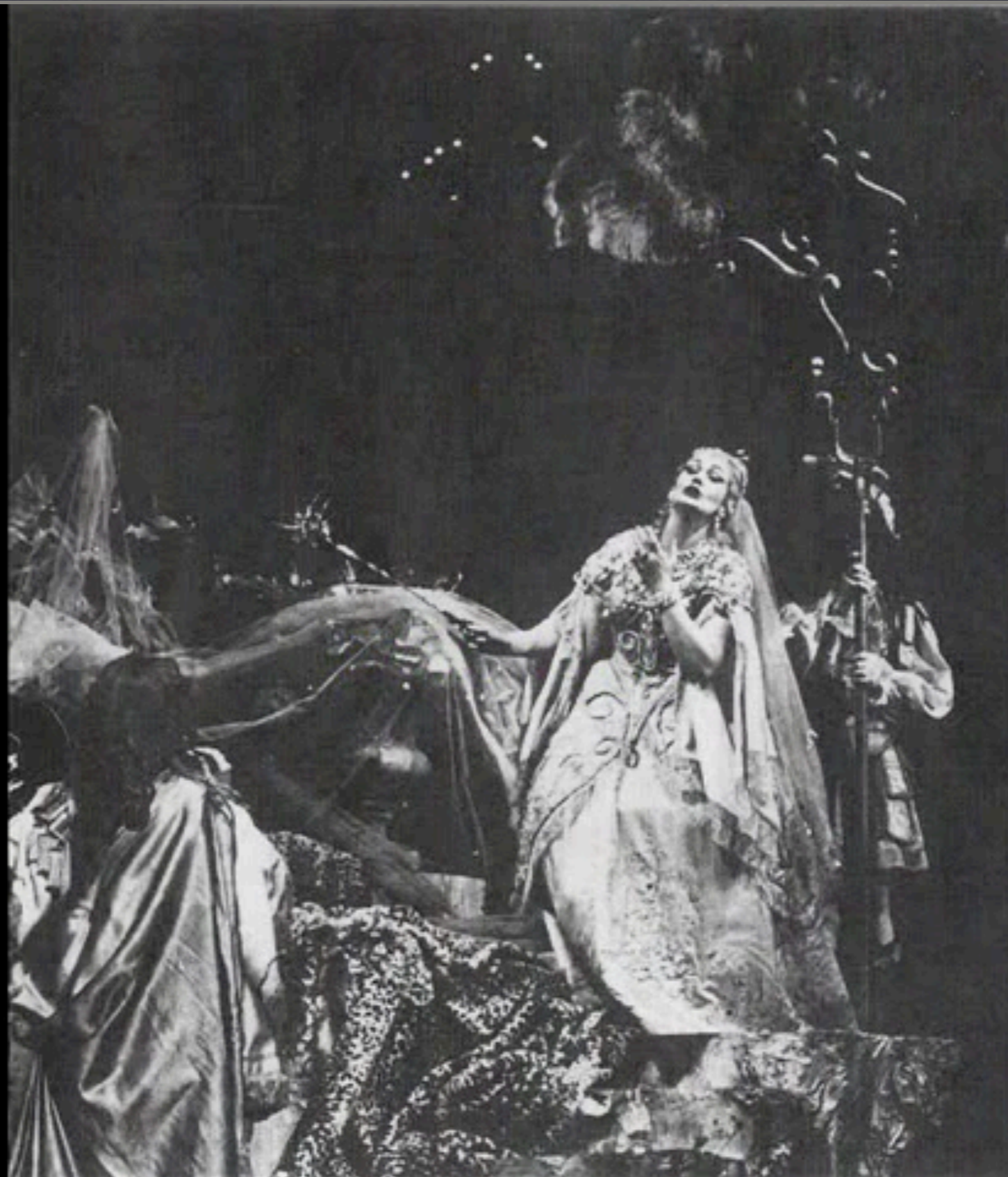
Ah, mio cor, schernito sei / Alcina de Georg Friedrich Händel Acto 2 o JOAN SUTHERLAND / ORQUESTA DE LA RADIO DE COLONIA / DIRIGE FERDINAND LEITNER / EMISIÓN RADIOFÓNICA 1959