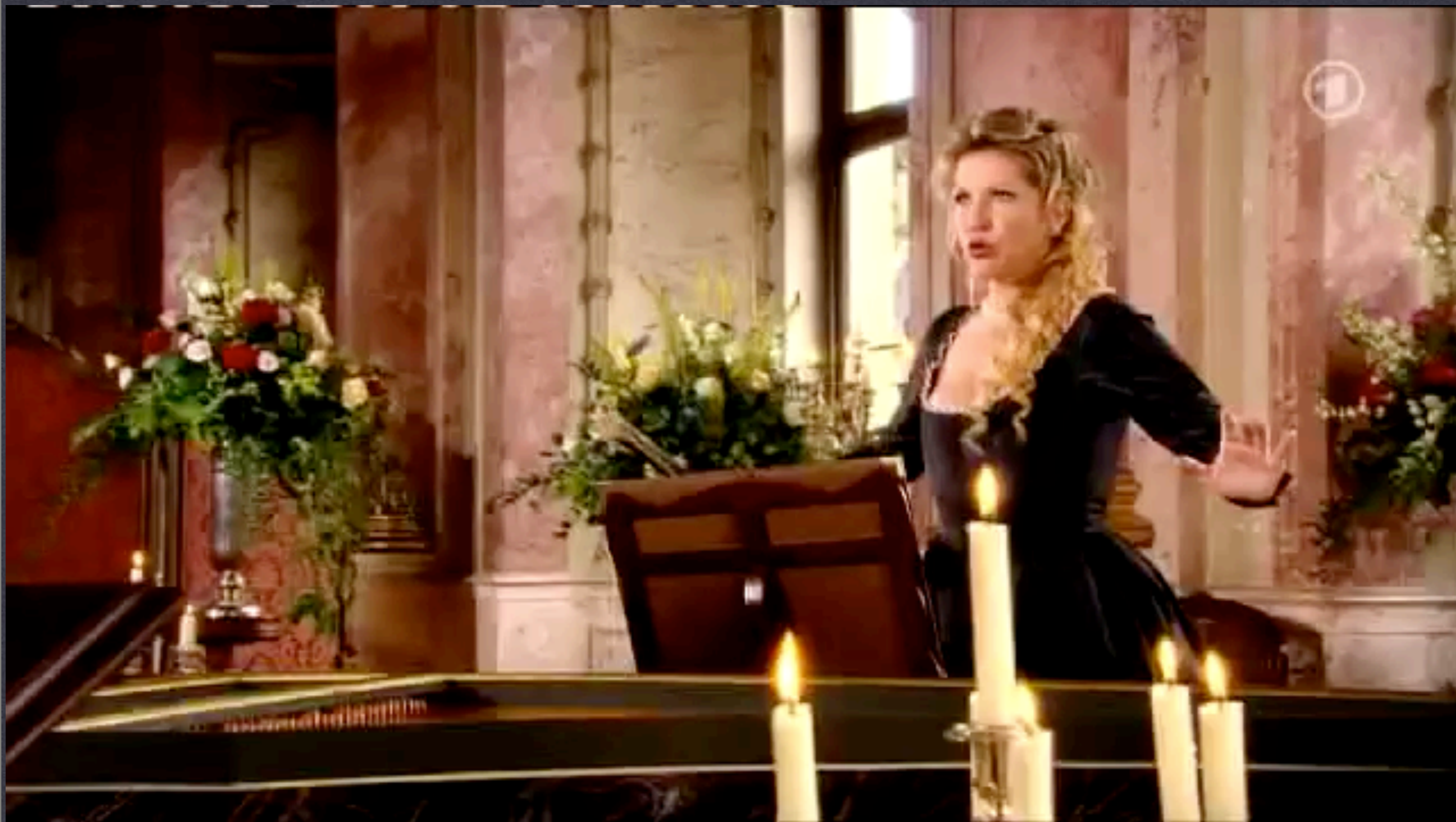
Crude furie degli orride abissi / Serse de Georg Friedrich Händel JOYCE DIDONATO INTERPRETA A "FRANCESCA CUZZONI" EN EL DOCUMENTAL "HANDEL: LIFE OF A POP ICON" 2009